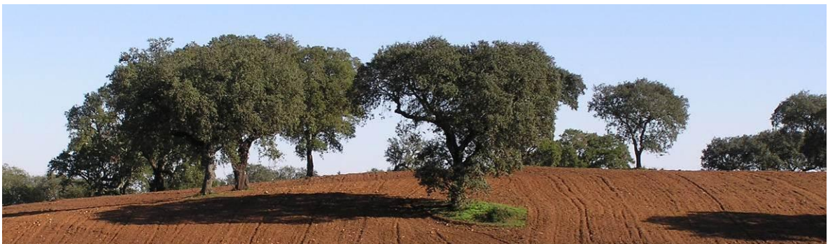
Figura 13 – Gradagens no montado deixando o solo nú.

Estas condições de degradação têm sido ainda aumentadas como resultado duma deficiente interpretação do sistema que ciclicamente recorre ao controlo das arbustivas através de operações de gradagem sem outra qualquer prática regenerativa do sistema que não seja esporadicamente uma cultural anual de cobertura (Figura 13).