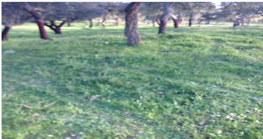
Figura 7 – Pastagem natural após aplicação de calcário dolomítico (1,5 – 3 ton/ha).

Os autores concluíram ainda que a aplicação de carbonato de cálcio aumenta a razão Mg/Mn principalmente por reduzir a absorção de Manganês, enquanto que a aplicação de sulfato de Magnésio aumenta essa razão por aumentar a absorção de Magnésio donde se concluiu que a aplicação de calcário dolomítico poderá ser eventualmente uma solução para a resolução do problema (Figura 7).