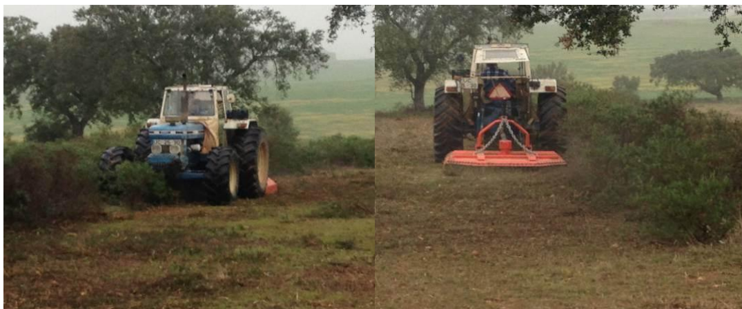
Figura 14 - Corte mecânico da infestação arbustiva com corta mato após aplicação de herbicida.

herbicida sistémico e sem poder residual, aplicado na fase vegetativa mais indicada para esta espécie vivazes, a floração, seguido do seu corte mecânico com equipamento adequado (vulgar corta mato - Figura 14), em alternativa ao controlo mecânico com operações de mobilização do solo como as gradagens, associado às práticas já enunciadas de correcção e fertilização do solo e da introdução de misturas de espécies herbáceas (leguminosas e gramíneas), podem contribuir para a melhoria das características físicas, químicas e biológicas dos solos, beneficiam o desenvolvimento vegetativo e a condição sanitária das árvores favorecendo a componente silvícola do sistema, a montanha e permitindo a intensificação sustentada da produção animal a partir dos ruminantes, sempre preservando o ecossistema e a necessidade da sua regeneração.