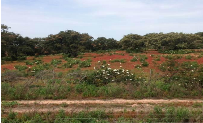
Figura 12- Montados, degradados pelo efeito negativo da sua utilização insustentada ao longo dos anos, com baixa fertilidade, permitindo apenas o desenvolvimento de plantas arbustivas.