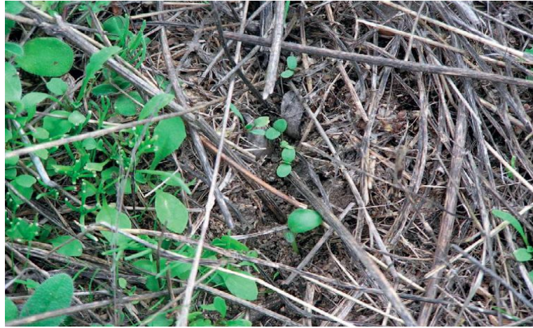
Figura 9 - A sementeira após as primeiras chuvas proporciona à vegetação espontânea uma maior capacidade competitiva.

Figure 9 - Sowing after the first rains gives to the spontaneous vegetation a greater competitive capacity.