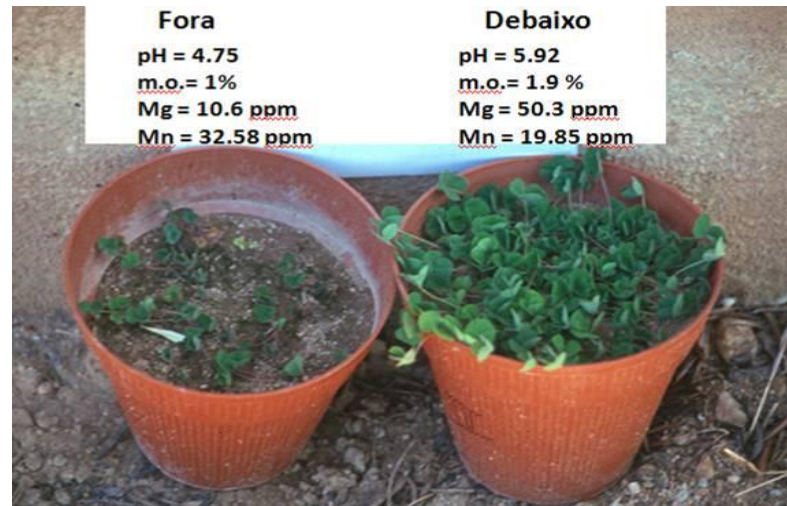
Figura 5 – Crescimento do Trevo-subterrâneo fora e debaixo da copa da árvore.