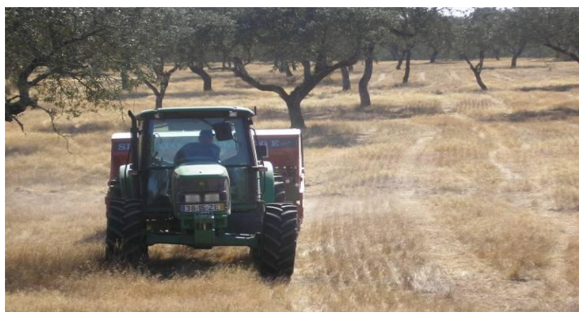
Figura 8 – Sementeira/melhoramento de pastagem com sementeira direta.

A opção pela instalação ou melhoramento de pastagens através de sementeira direta, obriga tal como para as restantes culturas arvenses, à escolha criteriosa do equipamento de sementeira (semeador) (Figura 8) que deve possuir características de robustez e elevada capacidade de penetração em solos não mobilizados, possibilidade de operar com resíduos à superfície, capacidade de regulação dos distintos órgãos para as diferentes condições do solo na altura da sementeira, boa capacidade e regulação da densidade e sobretudo da profundidade de sementeira (sementes de calibre reduzido).