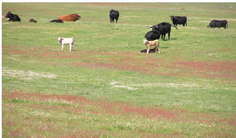
Figura 1- Pastagem natural de sequeiro com fraco potencial produtivo e má qualidade. Figure 1 - Natural pasture of dry land with low productive potential and low quality.

mau manejo...), compostas normalmente por uma população baixa de espécies anuais autóctones de escasso valor pratense, eventualmente algumas leguminosas anuais ( Trifolium cherleri , Trifolium hirtum , Trifolium glomerata , Ornithopus compressus ) e algumas gramíneas também anuais ( Lolium , Hordeum , Poa ) bem adaptadas, mas não melhoradas de forma a poder assegurar, com correctas opções de manejo, produções aceitáveis (Figura 1).