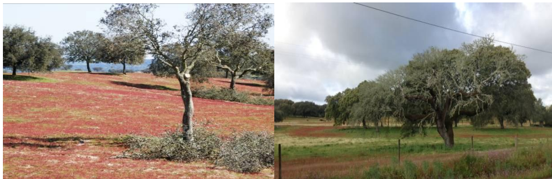
Figura 4 – Toxicidade de Manganês em pastagens.

pastagem, e também à fertilização racional na qual, pelo menos o Fósforo é o elemento essencial.