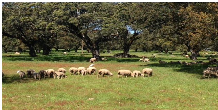
Figura 6 – Toxicidade de Manganês (Mg) em pastagem sob pastoreio.

De facto, conforme se pode verificar na figura, debaixo da copa da árvore o ambiente com uma reacção de solo menos ácida, com um teor mais elevado de matéria orgânica, maior disponibilidade de Magnésio e menor de Manganês, o trevo subterrâneo cresceu melhor. Também para Carvalho et al (1991), existe uma diferença significativa entre variedades na tolerância a situações de toxicidade de Manganês, sendo o recrescimento da planta após o primeiro corte mais afectado que o crescimento inicial (diminuição da razão Mg/Mn devida à diminuição da concentração interna dos dois iões na planta), o que afectará a capacidade competitiva das plantas com a vegetação espontânea em situações de campo com pastoreio (Figura 6).