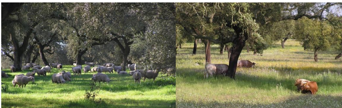
Figura 15 - O Alentejo permite a manutenção dos animais em pastoreio ao longo de todo ano.

importantes do ponto de vista nutritivo ( ratio energia/proteína) e ao removerem o excesso de Azoto, evitam a invasão por espécies nitrófilas (cardos, etc.).