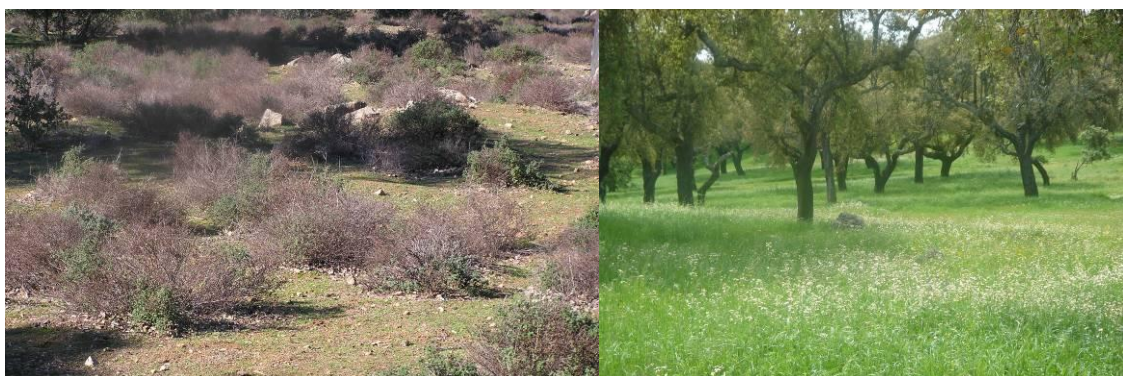
Figura 2 - A degradação de solos e recursos herbáceos para pastagem, pode ser conseguida através do melhoramento e constituição de pastagens permanentes biodiversas ricas em leguminosas.

isso necessário mantê-lo com as suas características de origem, eventualmente melhorá-las evitando que seja degradado, erosionado e transportado por escorrência para os ribeiros, rios, barragens ou para o mar. Assim, a inversão do ciclo de degradação de solos e recursos herbáceos para pastagem, pode ser conseguida através do melhoramento e constituição de pastagens permanentes biodiversas ricas em leguminosas que contribuirão para a melhoria das características físicas, químicas e biológicas dos solos e permitirão a intensificação da produção animal a partir dos ruminantes (Figura 2).