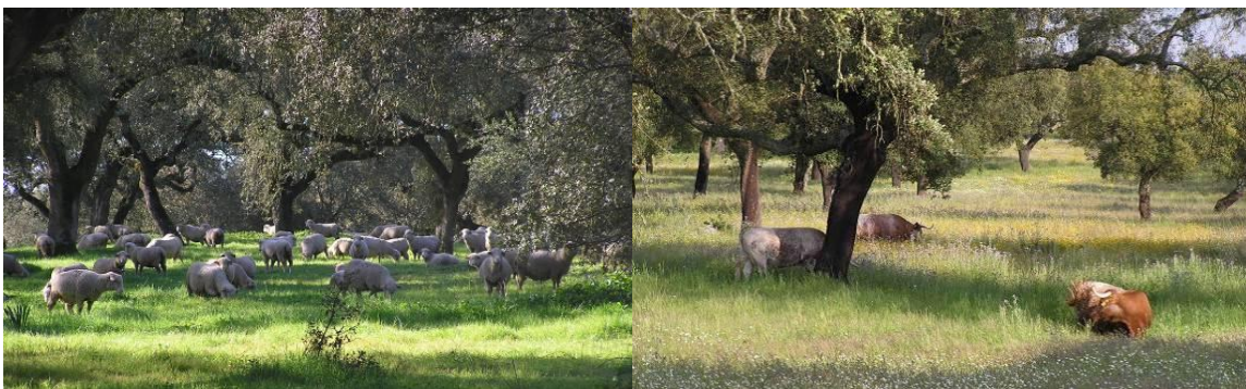
Figura 16 - As Raças Autóctones, com rusticidade têm uma notável capacidade para produzirem em regimes extensivos.

Nas nossas condições de exploração em extensivo, as Raças Autóctones, cujos animais de elevada rusticidade possuem uma predisposição particular para o aproveitamento de alimentos grosseiros de escasso valor alimentar e uma notável capacidade de variação da condição corporal ao longo do ano em baixos regimes alimentares, desequilibrados total ou parcialmente, são outra “arma” interessante... (Figura 16).