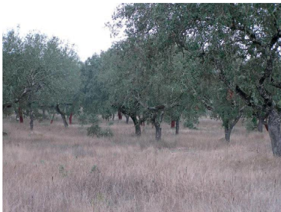
Figura 10 - Zona mal pastoreada.

Nestas condições, é obrigatório o pastoreio para remoção da maior parte dos resíduos (Figura 10 e 11), de forma a evitar os problemas referidos da mesma forma que a sementeira direta em pastagens em zonas de infestação generalizada com espécies arbustivas terá que ser precedida por uma qualquer estratégia de controlo destas.